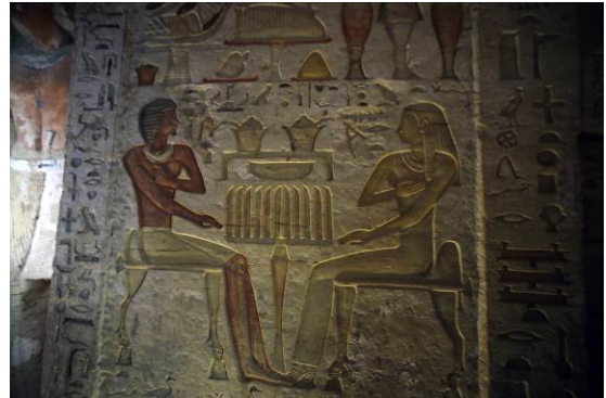
Eén van de taferelen

Ten zuiden van de Egyptische hoofdstad Caïro is een 4400 jaar oud graf van een priester ontdekt. De tombe is verrassend goed bewaard gebleven. Hij is versierd met tekeningen en hiërogliefen. Ook staan er 24 gekleurde beelden. De archeologen verwachten in de komende weken nog meer ontdekkingen te doen.